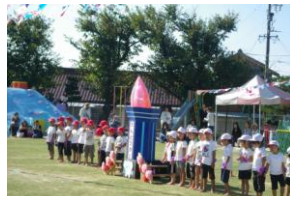
幼保、それぞれの個性をいかして