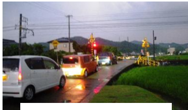
2時間半も閉じていた踏切

質問① 7月25日の集中豪雨で、名鉄小牧線羽黒～楽田間の遮断機が約2時間半にわたり故障、小牧線を挟んで東西の交通がマヒした。この日は幸い消防車救急車等の出動はなかったが、もし、出動していたら到着に大変な時間を要したと思われる。楽田東部の災害時の脆弱さが露呈したが、対策はどうか。